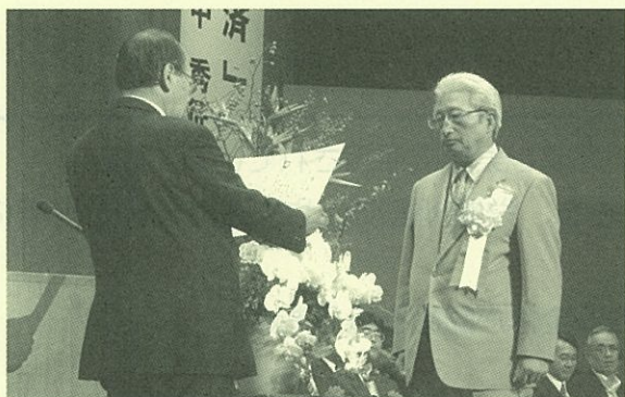
「全国建設業労働災害防止大会」において顕彰される受賞者

当協会では、建設業安全衛生に係る発明・研究・活動等により労働災害防止に顕著な功績があった方々を顕彰するため、発明・考案等の作品を募集しています。