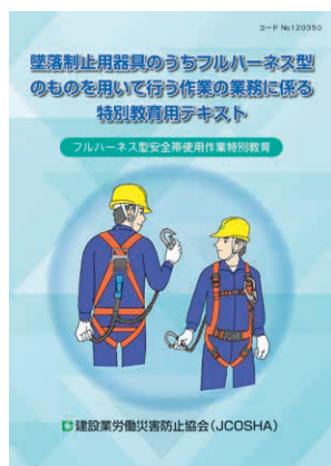
フルハーネス型安全帯使用作業 特別教育用テキスト