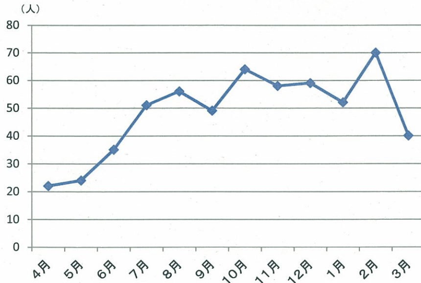
過去5年間(平成20年度～平成25年度)の月別の死亡者数